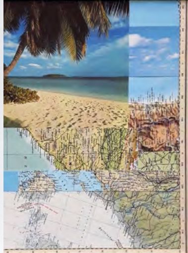
Alberto Storari, Land Escape Series, Collage