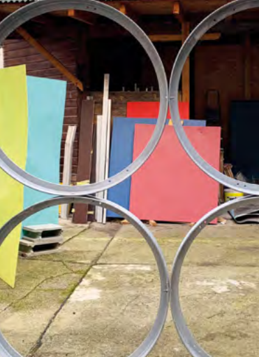
Michael Kienzer, Skulptur