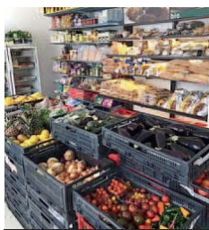
„Foodpoint“ in Wr. Neustadt.

wird von Supermarktketten und Produzenten unterstützt. Auch private Spender können Lebensmittel abgeben – originalverpackt und haltbar, etwa Reis, Mehl oder Zucker. Der Foodpoint (Pleyergasse 3) ist MO-SA von 14 bis 17 Uhr geöffnet.