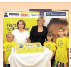
Tortenessen mit LR Schwarz u. WKNÖ-Chefin Sonja Zwanzl.

St. Pölten. 900 Kids und Teens durften im Rahmen der 2. Kinder Business Week im WIFI St. Pölten ins Unternehmerleben eintauchen. Zum Abschluss lud LR Barbara Schwarz (ÖVP) zu einer Feier inklusive Torte.