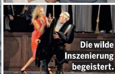
Die wilde Inszenierung begeistert.