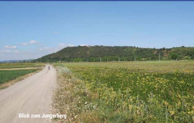
Blick zum Jungerberg