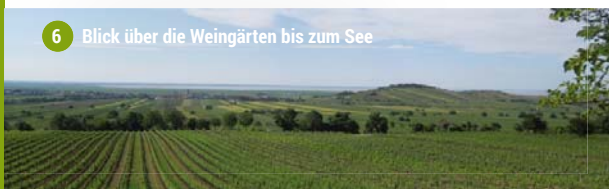
6 Blick über die Weingärten bis zum See