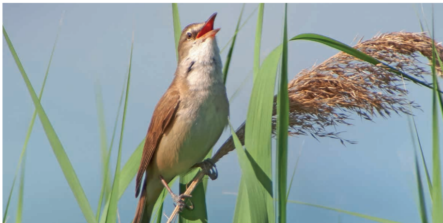
Ein Drosselrohrsänger im Schilf