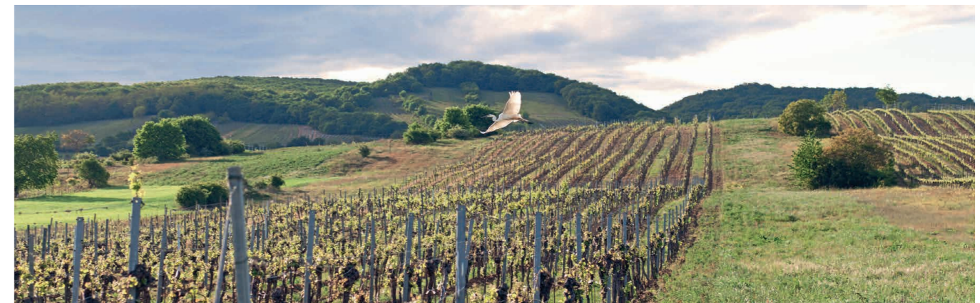
Wo eng verbundene Lebensräume die Grundlage für außergewöhnliche Weine bilden, fühlen sich auch Schilfvögel im Weingarten wohl.

Die Weinschaukel - Picknick zwischen Weingärten ✉ order@designwinzerin.at 🌐 www.weinschaukeln.at