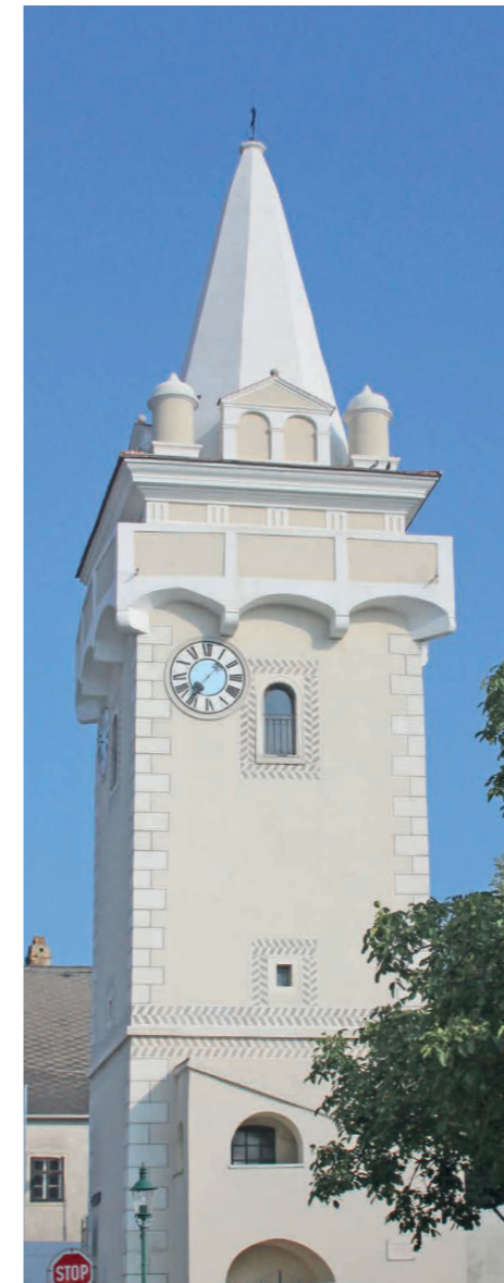
Das Turmmuseum mit traumhaften Weitblick in Breitenbrunn am Neusiedler See

Bereits in der Jungsteinzeit befanden sich Siedlungen am Südufer des Neusiedler Sees. Später wanderten Kelten in die Region ein. Spuren römischer Siedlungen aus der Zeit, in der die Provinz Pannonia zum Römischen Reich gehörte, lassen sich noch heute finden. In der Phase der Völkerwanderung besiedelten verschiedenste Stämme das Gebiet.